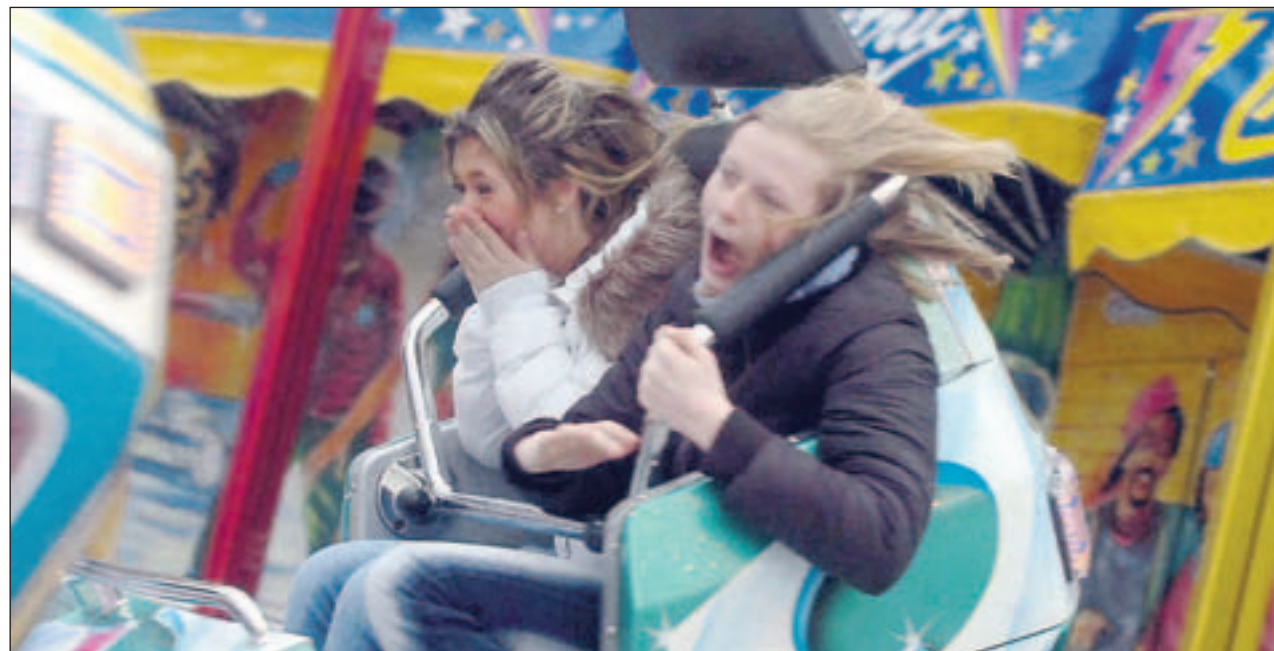
Der Breakdancer sorgt bei den Fahrgästen für ein flaes Gefühl in der Magengegend.

Bis zum 1. April bleibt die Feststadt auf dem Schützenplatz geöffnet